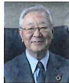
中西 宏明氏 日本経済団体連合会 会長

国内外の国際機関や政府関係者、学識経験者、企業経営者らの有識者が、SDGs実現への課題などについて議論します。受講無料(申し込み多数の場合は抽選となります)。